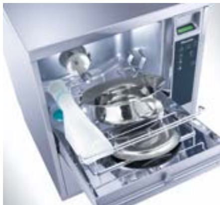
Esempi di carico

* La capacità dipende dal tipo di oggetti da lavare e può variare. Sono possibili diverse combinazioni di pappagalli e padelle.